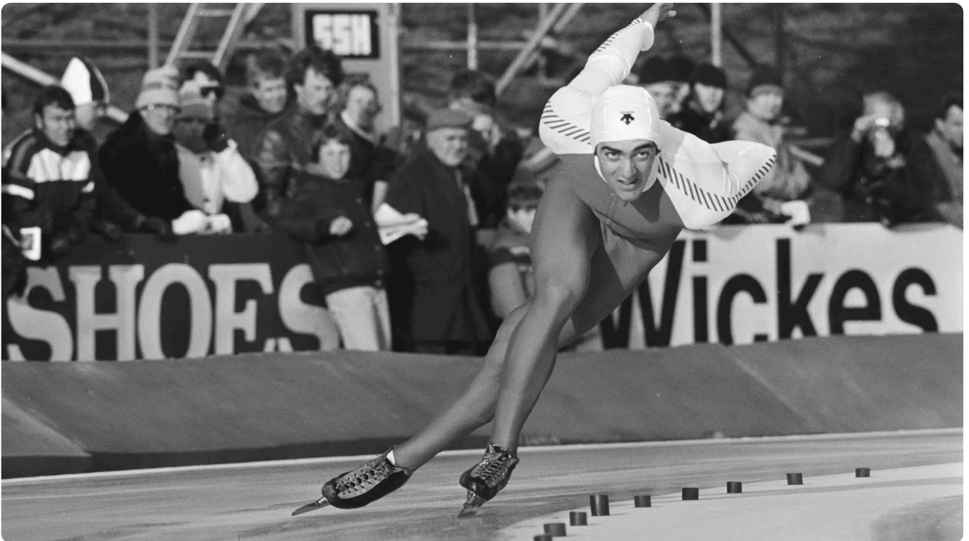
Gaétan Boucher was een wereldtopper in de jaren 80 van de vorige eeuw.